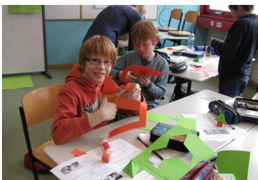
Hier werden mathematische Figuren geschnitten

Der MatheTreff 3456 Karlsruhe wurde eingerichtet, um jüngeren begabten Schülerinnen und Schülern eine Möglichkeit zu bieten, sich außerhalb der Schule mit Mathematik zu beschäftigen. Er wird vom Zentrum für Mathematik (Bensheim) in Kooperation mit dem Gymnasium Neureut angeboten.