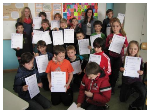
Am Schluss gibt's eine Urkunde

Es handelt sich also nicht um zusätzlichen „normalen“ Mathe- Unterricht, sondern um eine kreative, an der Freude am Entdecken orientierte Form der Beschäftigung mit Fragen der Mathematik.